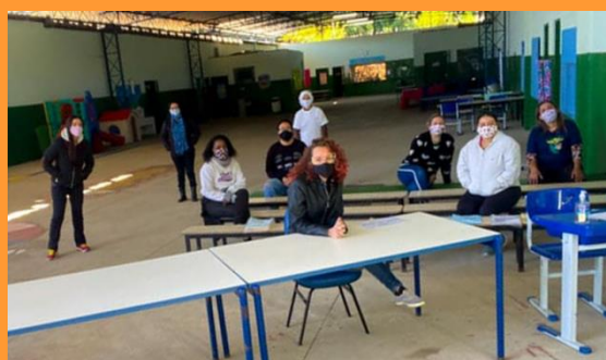
Na Unidade ITAIM, equipe do Integral auxilia na distribuição de materiais aos alunos