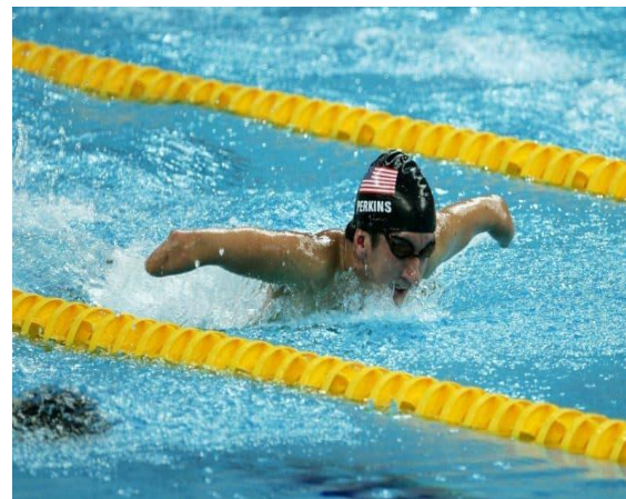
NATAÇÃO ( )