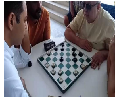
JOGO DE DAMA ( )