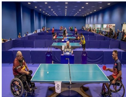
TÊNIS DE MESA ( )