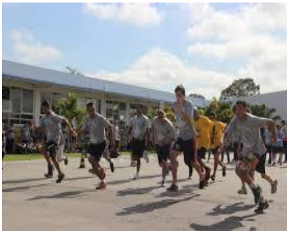
CORRIDA DE RUA ( )

FAÇA UM X NAS MODALIDADES DE JOGOS PARALÍMPICOS QUE VOCÊ CONHECE E QUE SÃO DESENVOLVIDAS NOS JOGOS QUE ACONTECEM NA ESCOLA “MADRE CECÍLIA”.