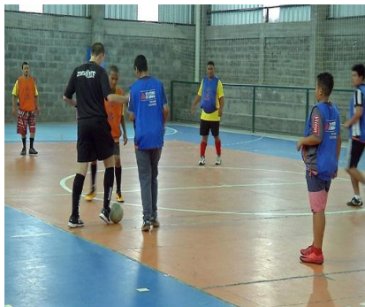
FUTSAL ( )