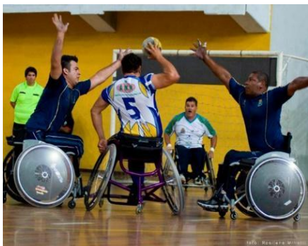
HANDEBOL ( )