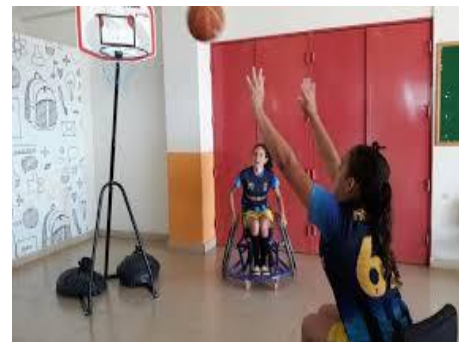
BASQUETE ( )