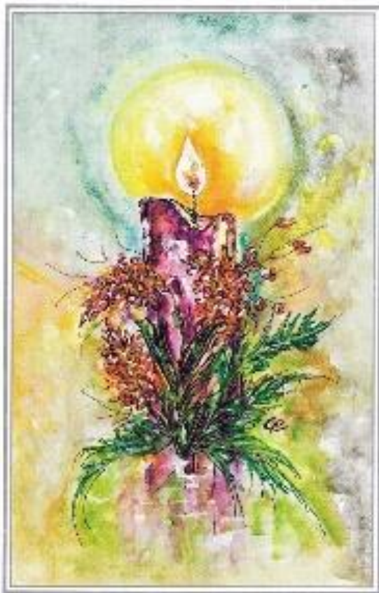
“Vela natalina” Pintado com a boca e o pé Goret Chagas