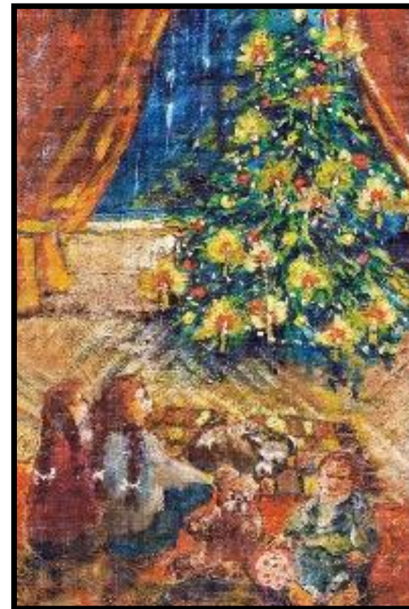
“Noite de natal” Pintado com o pé László Kormos