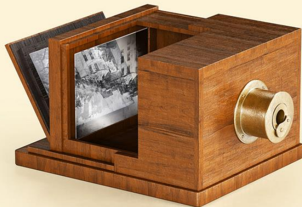
Daguerreótipo, modelo de 1839