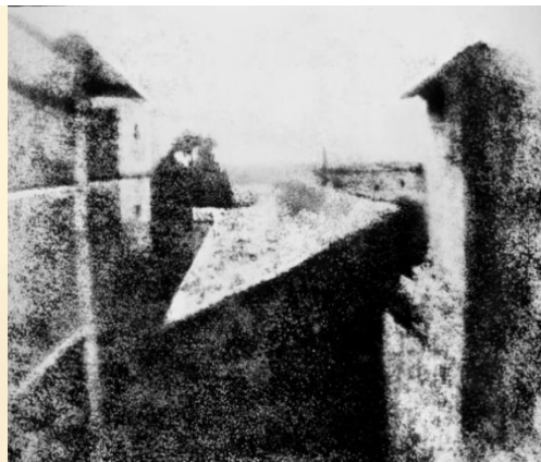
1ª foto, registrada em 1826

A primeira fotografia da história foi feita em 1826 , capturando a vista de uma janela na região de Le Gras, na França. Foram necessárias oito horas de exposição para registrar a imagem em uma placa de estanho de cerca de 20 x 16 cm. Já em 1839, surgiu o Daguerreótipo, primeira câmera que chegou ao grande público e reduziu o tempo de exposição para 15 minutos. Ainda assim, consegue imaginar ficar parado por todo esse tempo? Não é a toa que antigamente as pessoas saíam sentadas e sem sorrir nas fotos.