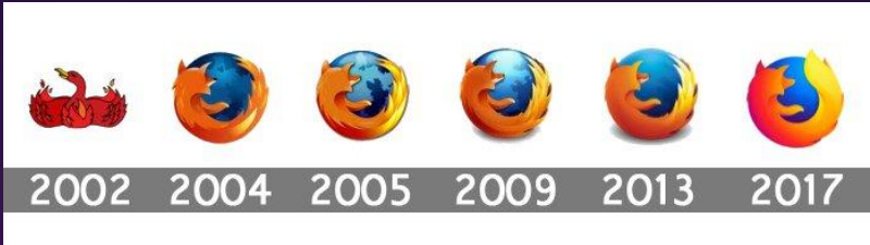
Evolução do logo do Mozilla Firefox

Lançado em 2002 , ao contrário do que sugere o nome, o animal que aparece no logo do navegador Firefox não é uma raposa, mas sim um panda vermelho. O bicho é um mamífero de porte pequeno com pelos vermelhos e manchas brancas na face e está em perigo de extinção. É conhecido também como “raposa de fogo”, ou seja, “ firefox ” em inglês. Como o panda vermelho não é muito conhecido, o designer que fez o logo acabou usando traços de uma raposa, aumentando a confusão.