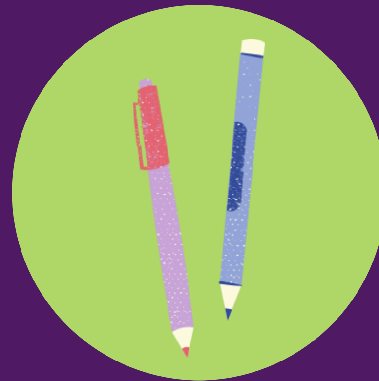
Lápis ou caneta