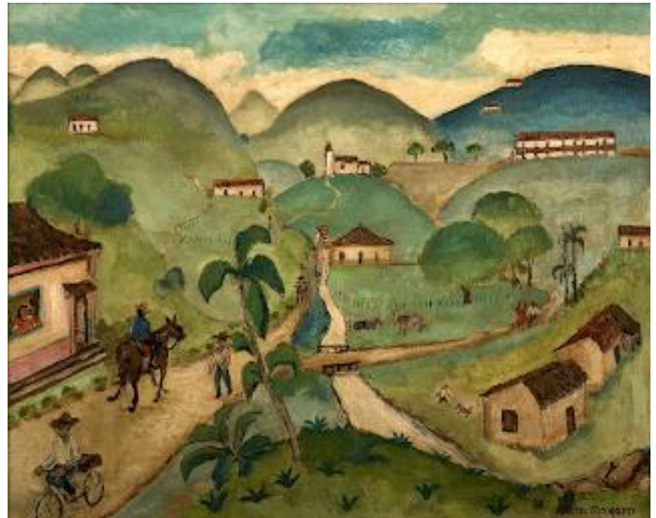
ENTRE MORROS E RODA D'ÁGUA, 1950

https://1.bp.blogspot.com/-MsWv8ckdtfQ/UY7oWLu7EVI/AAAAAAAAIy0/Dc6NKeyPWts/s320/Anita+Malfatti+obra+011.PNG