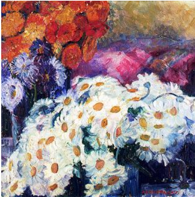
AS MARGARIDAS DE MÁRIO, 1922

https://4.bp.blogspot.com/-wTIL6XhXGNM/UY7I4LmcPDI/AAAAAAAAIyU/FjQ3aUrJNbQ/s320/As+Margaridas+de+M%C3%A1rio+,+1922+%%C3%B3leo+sobre+tela,+c.i.d..jpg