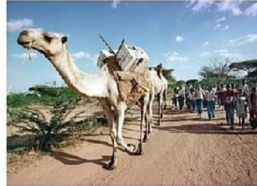
Dromedário-biblioteca na região Somali, na Etiópia, norte da África

Mais de 20 dromedários carregam caixas de madeira com livros —cada animal leva cerca de 200 volumes. Eles são escoltados por voluntários da organização. A biblioteca móvel transita por mais de 30 vilarejos da região, distantes de grandes centros.